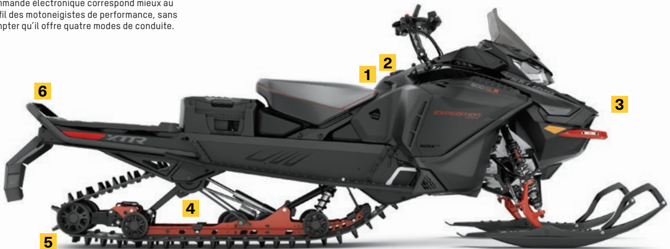
EXPEDITION XTREME 900 ACE TURBO R MONTRE

La plateforme REV® Gen4 et la suspension avant hybride RAS X permettent de manœuvrer sans effort dans la neige profonde, tandis que la chenille Cobra WT de 20 x 154 x 1,8 po procure une traction et une flottaison incroyables.